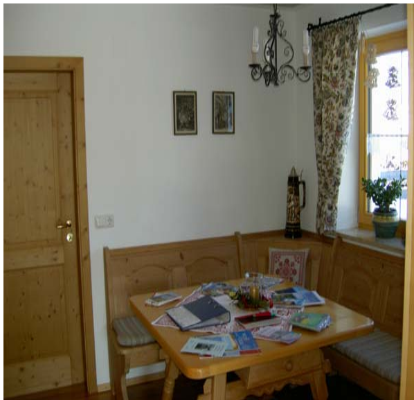
Das Wohn- und Esszimmer

Unser Haus befindet sich an ruhiger Ortsrandlage mit herrlichen Blick auf die Ammergauer Alpen. Die neu erbaute Ferienwohnung bietet Ihnen größtmöglichen Komfort für Ihren erholsamen Urlaub und ist nach den Qualitätsanforderungen des Deutschen Tourismusverbandes mit 4 Sternen ausgezeichnet. Von unserem Haus können Sie direkt Wanderungen zur Ammerschlucht oder zu der Kneippanlage Bärenbachweg unternehmen.